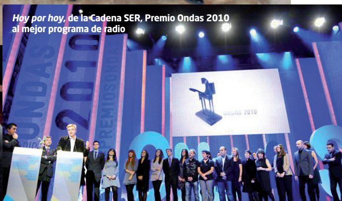
Hoy por hoy, de la Cadena SER, Premio Ondas 2010 al mejor programa de radio