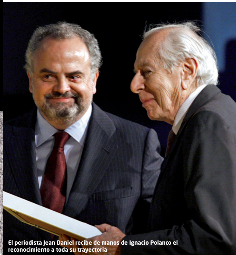
El periodista Jean Daniel recibe de manos de Ignacio Polanco el reconocimiento a toda su trayectoria