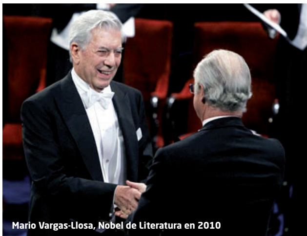
Mario Vargas-Llosa, Nobel de Literatura en 2010