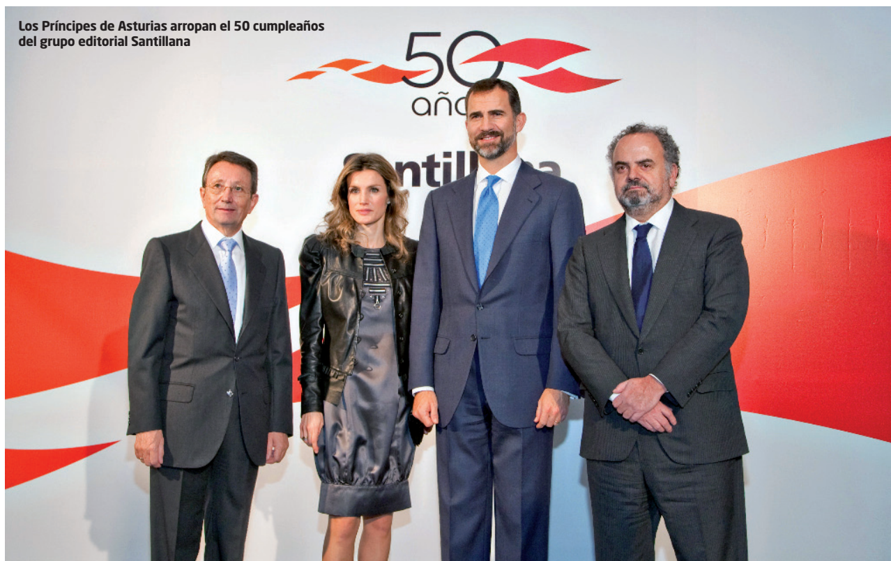
Los Príncipes de Asturias arropan el 50 cumpleaños del grupo editorial Santillana