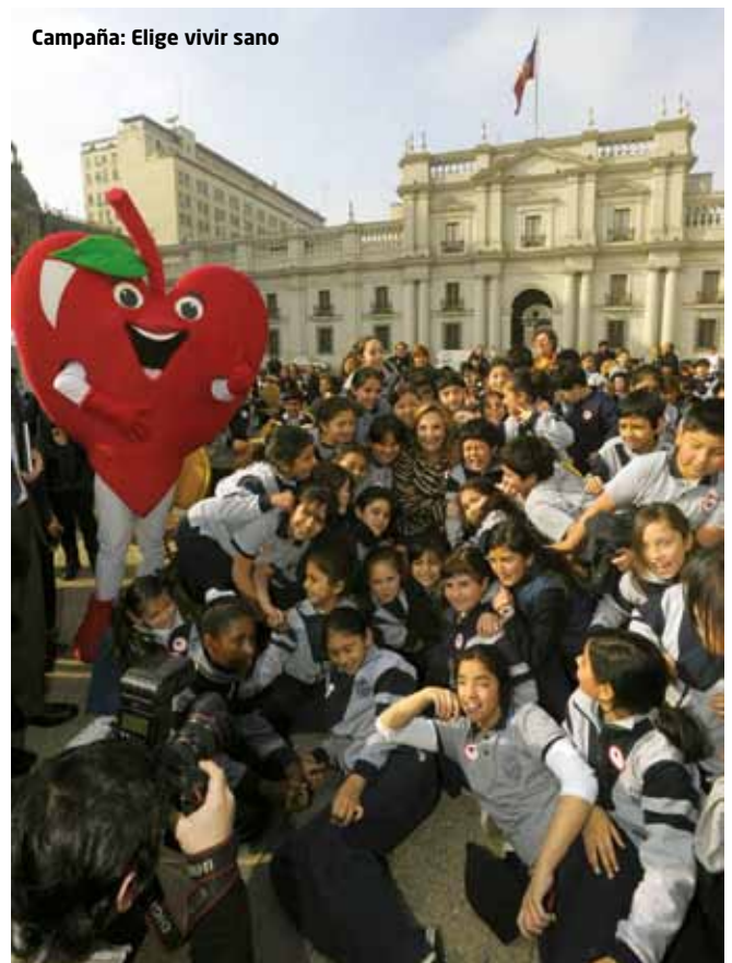
Campaña: Elige vivir sano

Como en años anteriores, también se realizaron varias campañas de recogida de donativos por parte de las radios del Grupo destinadas a diversas instituciones como son Ajuda de Mãe, Associação Salvador, Associação para a Promoção da Segurança Infantil o Associação Terra dos Sonhos.