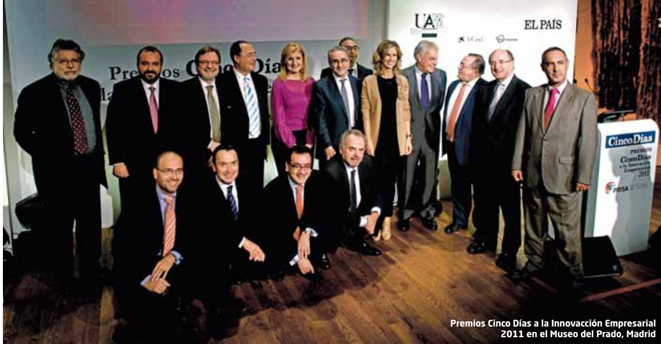
Premios Cinco Días a la Innovación Empresarial 2011 en el Museo del Prado, Madrid

El Premio Alfaguara de Novela se ha convertido en un referente de los galardones literarios de calidad otorgados a una obra inédita escrita en castellano. Su vocación y proyección en todo el ámbito del idioma español en el mundo ha propiciado una difusión internacional de primer orden, apoyado por la edición simultánea de las obras ganadoras en España y América. Un total de 608 manuscritos inéditos, escritos en castellano, concurrieron en esta XIV Edición.