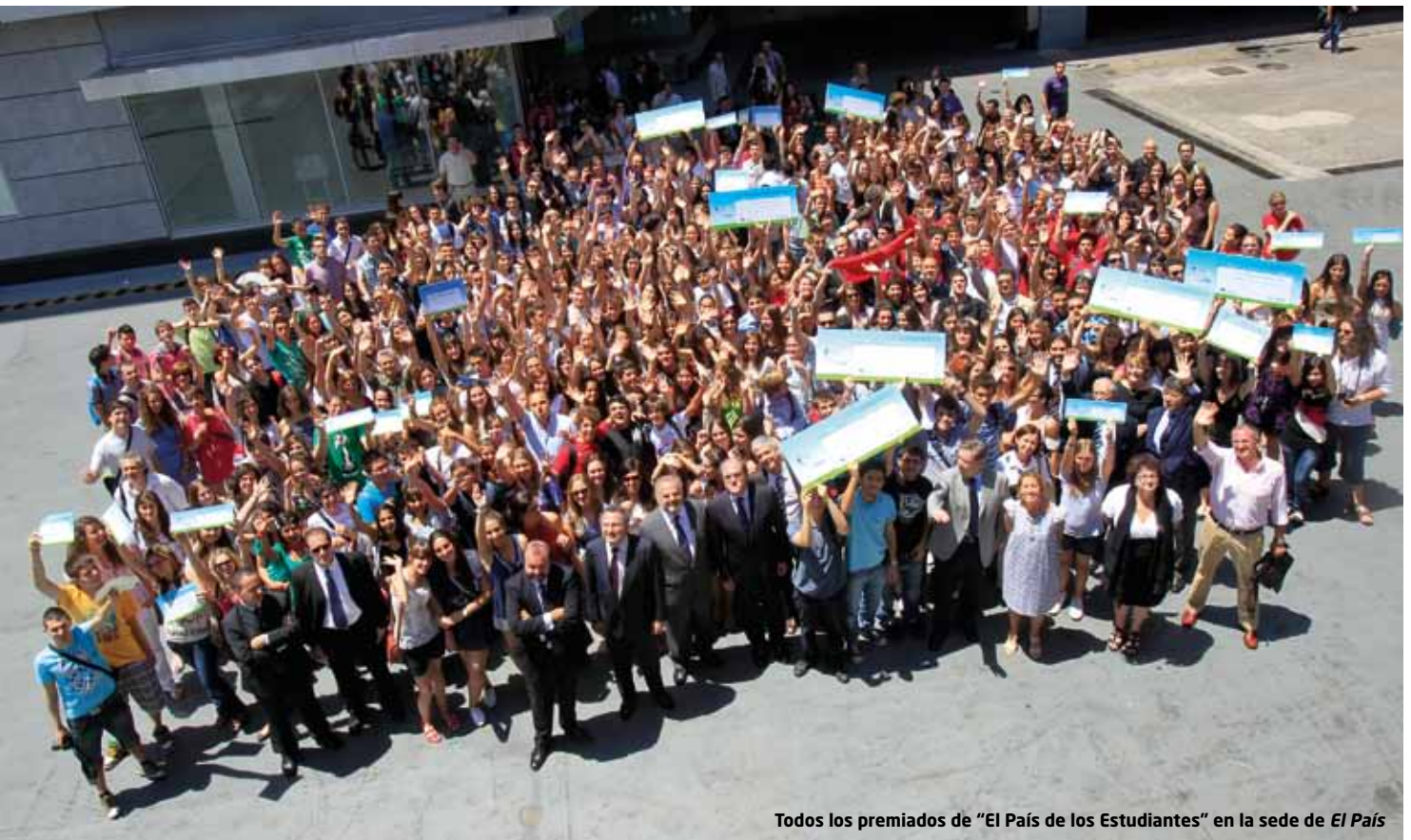
Todos los premiados de "El País de los Estudiantes" en la sede de El País

mediante un sistema de maquetingación a través de Internet facilitado por el diario El País . En el curso escolar 2010-2011, participaron más de 43.000 alumnos distribuidos en casi 10.000 equipos de 2.646 centros de enseñanza.