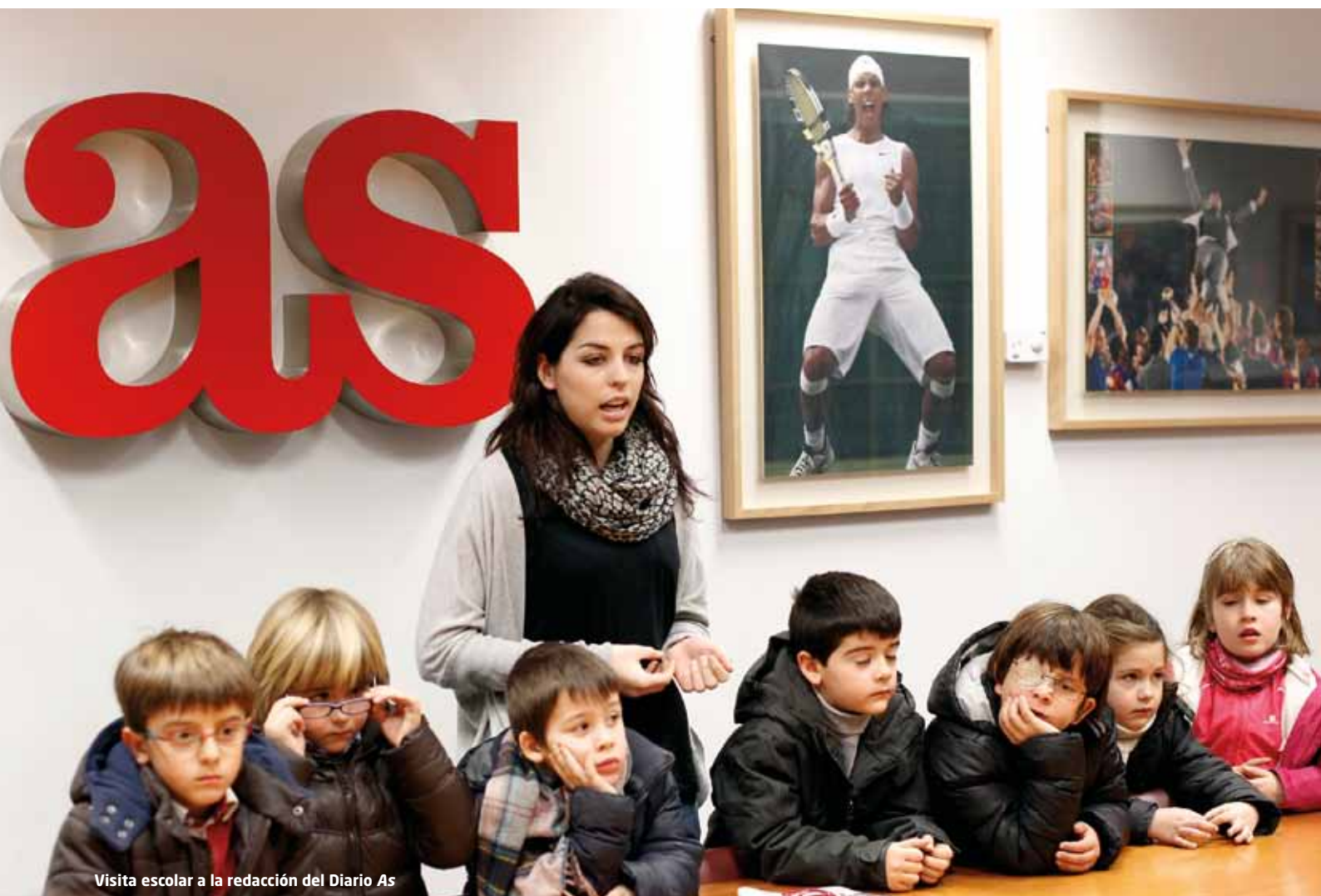
Visita escolar a la redacción del Diario As

Al margen de la edición de los libros de texto, actividad principal de Santillana, se producen una gran cantidad de materiales dirigidos a los profesores, a los alumnos, a la