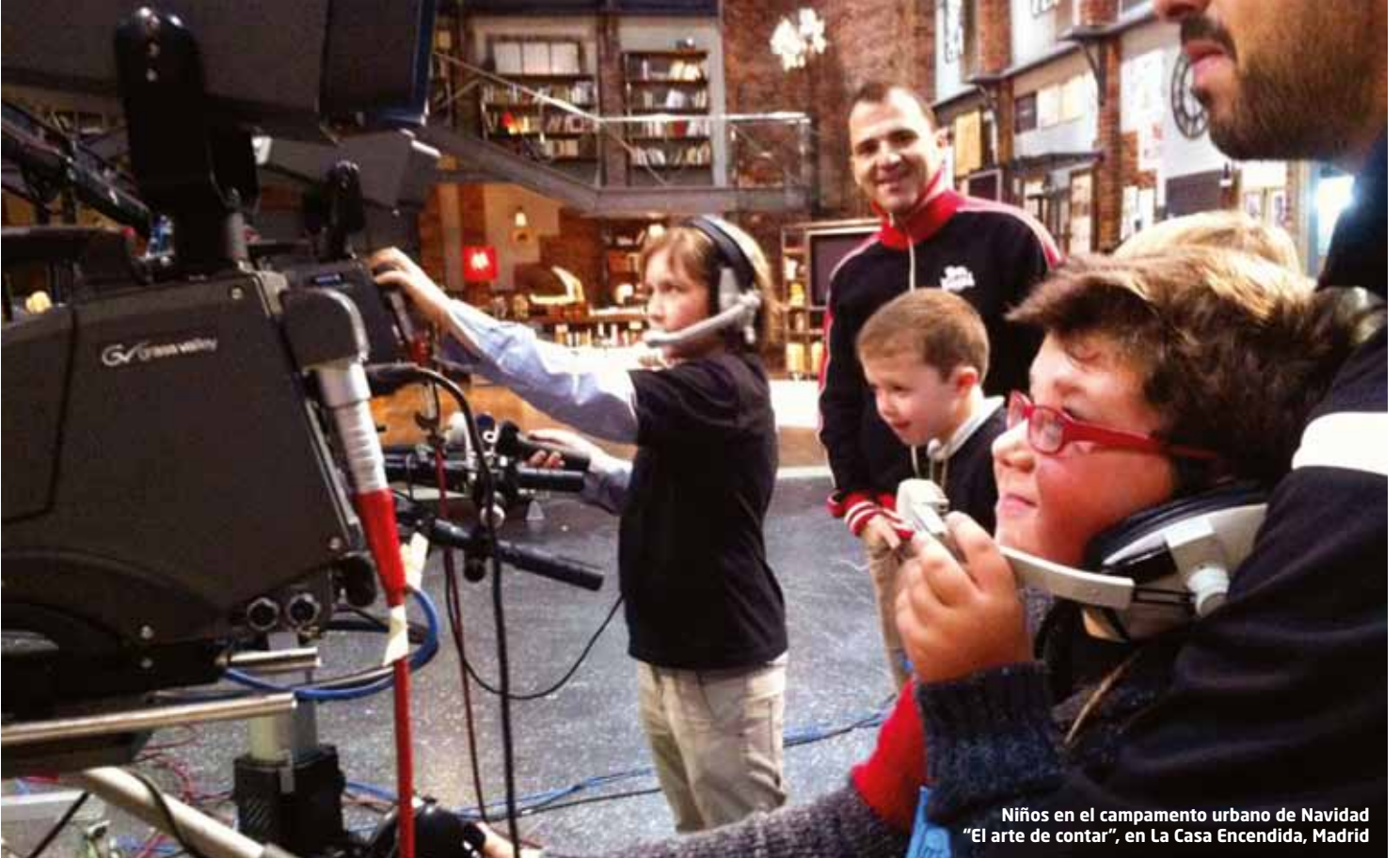
Niños en el campamento urbano de Navidad "El arte de contar", en La Casa Encendida, Madrid

exposición fotográfica en el Instituto Cervantes con las instantáneas y reportajes publicados en este suplemento bajo la serie Testigos del olvido , que ha tuvieron una gran acogida.