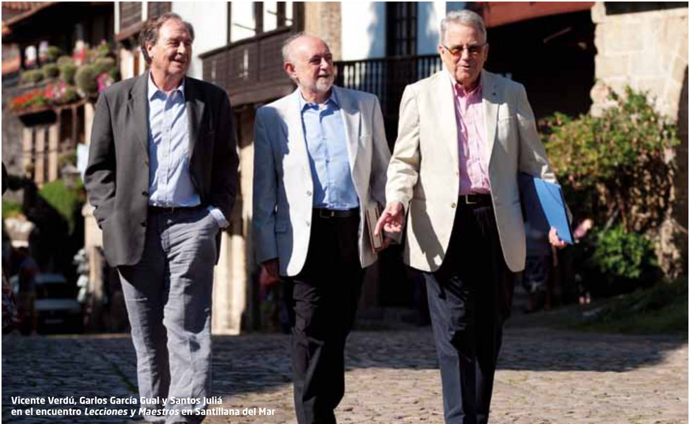
Vicente Verdú, Carlos García Gual y Santos Juliá en el encuentro Lecciones y Maestros en Santillana del Mar