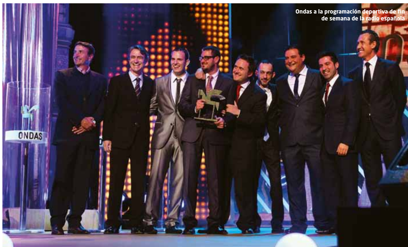
Ondas a la programación deportiva de fin de semana de la radio española