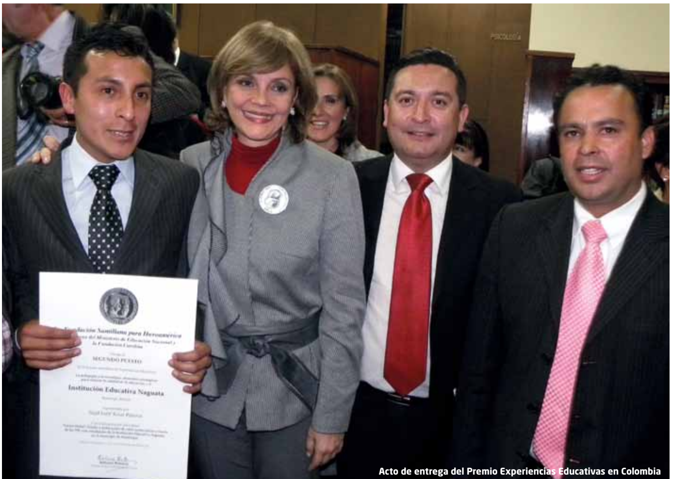
Acto de entrega del Premio Experiencias Educativas en Colombia